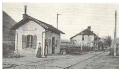
Gare de Bernin vers 1900