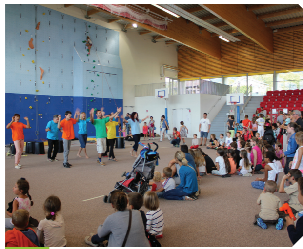
Spectacle de Lézarts en Vie

On se réjouit aussi de la présence inédite de l'ACCA Diane dans une démarche de sensibilisation des Berninois sur leurs actions pour la gestion de l'équilibre de la faune sauvage, ainsi que du retour au forum du Club Berninois venu nous présenter ses nombreuses créations.