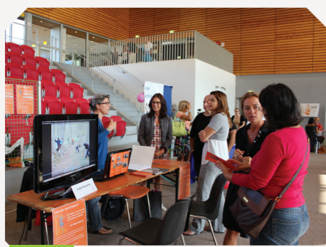
Stand de Corps Emouvance lors du forum

Une dizaine de familles ont pu rencontrer Madame le Maire, ainsi que quelques uns des adjoints et conseillers municipaux, autour d'un buffet composé de produits des commerçants de la commune, et ont reçu un petit cadeau de bienvenue.