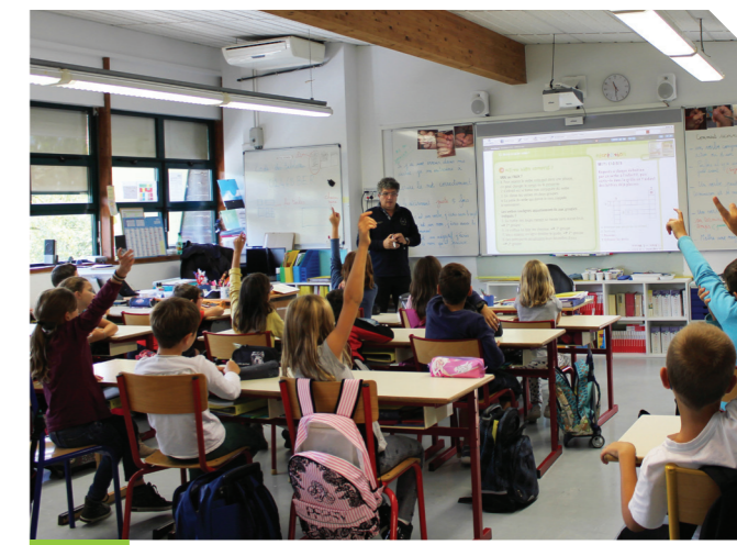
Installation du premier VPI

Cette démarche auprès des enseignants fut très bien accueillie et nous leur souhaitons une bonne prise en main. Notre accompagnement se poursuivra car notre volonté est d'étendre ce dispositif auprès d'autres classes qui le souhaiteront lors des rentrées prochaines.