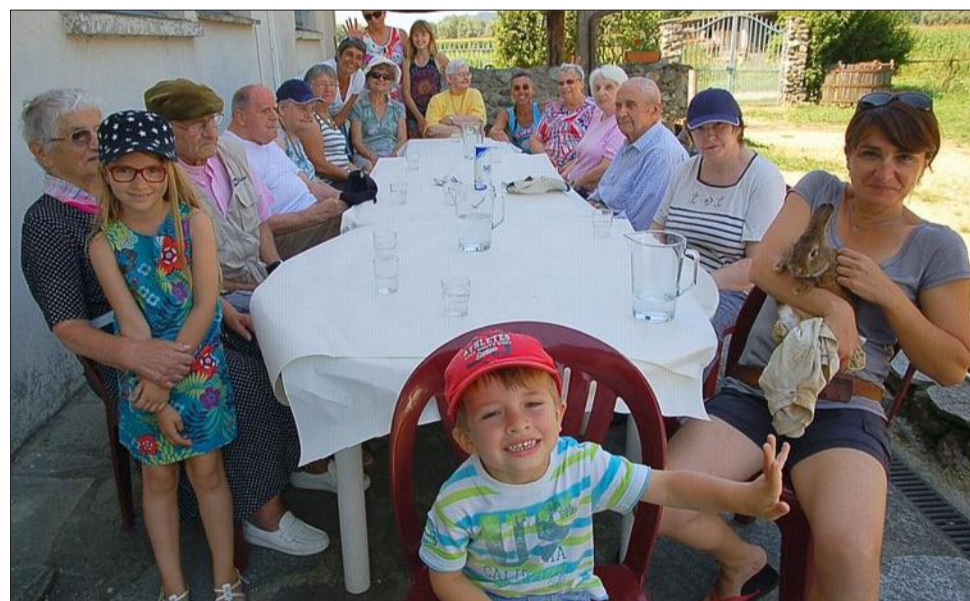
Plusieurs générations réunies autour de la table du pique-nique avec les résidents de la maison Saint-Jean.

Une bonne vingtaine de pensionnaires de la maison de retraite du Touvet sont venus passer la journée à la Ferme d'antan vendredi dernier.