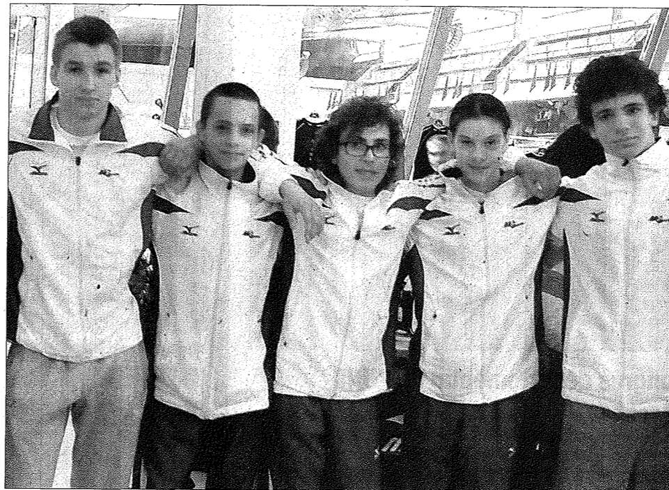
Malgré leur déception, les judokas cadets engrangent un peu plus d'expérience dans les compétitions nationales de haut niveau.