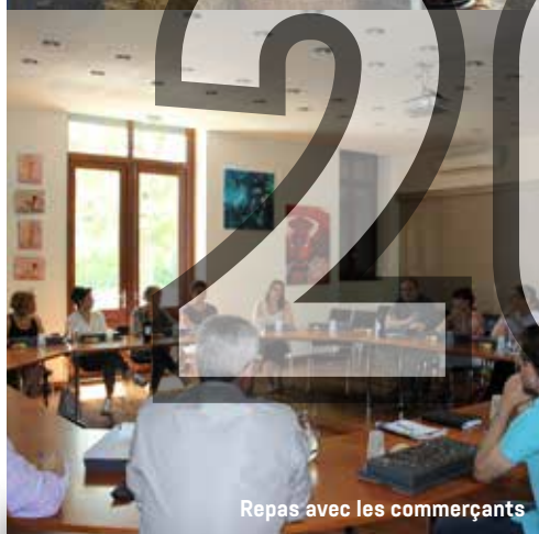
Repas avec les commerçants