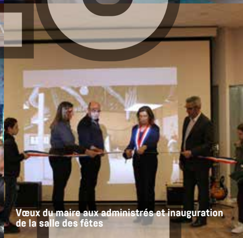
Vœux du maire aux administrés et inauguration de la salle des fêtes