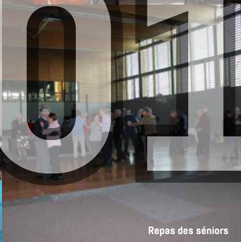
Repas des seniors