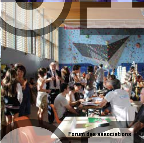
Forum des associations