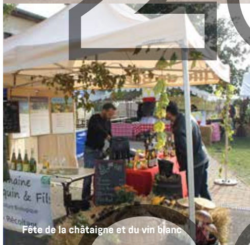
Fête de la châtaigne et du vin blanc