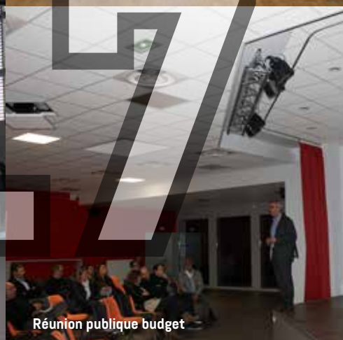
Réunion publique budget