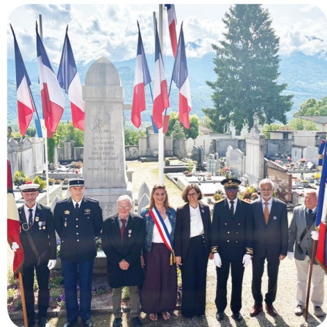
Commemoration du 8 mai

La cérémonie du 81 ème anniversaire de la "Victoire du 8 mai 1945" s'est déroulée au monument au mort en présence de Mme la maire, accompagnée de Mme la ministre déléguée chargée de l'Autonomie et des Personnes handicapées, M. le secrétaire général de la préfecture de l'Isère et de M. le conseiller délégué au devoir de mémoire.