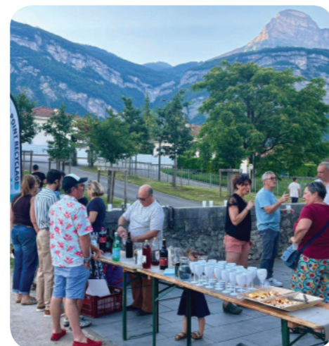
Fête des voisins

Dans le cadre du 39 ème anniversaire du jumelage entre Bernin et Kieselbronn, un groupe de 6 cyclistes (4 Berninois et 2 Kieselbronner) a relevé ce pari un peu fou : rejoindre Kieselbronn à vélo (650 km en 5 jours) accompagné d'une équipe logistique. Le départ avait été donné le dimanche 10 mai en présence des membres du comité de jumelage, de Mme la maire et des berninois.es venus encourager les cyclistes au départ. Malgré des conditions météo difficiles, les participants ont tenu leur engagement en roulant près de 130 km par jour ! Pendant ce temps, d'autres membres de la délégation avaient rejoint la rencontre en bus pour se retrouver à Kieselbronn pour le week-end de l'Ascension du 14 au 17 mai.