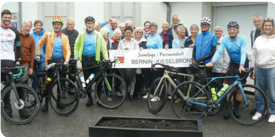
Périple du jumelage "à vélo" pour Kieselbronn

Le vendredi 24 avril, avait lieu à la salle des fêtes, la pièce de théâtre "La système de Ribadier" de Georges Feydeau par le Théâtre sous la Dent. Une mise en scène de Pascale Odier, offrant un moment de pur plaisir aux amateurs de théâtre de boulevard venus nombreux.