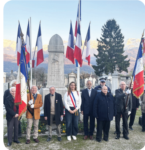
Commemoration du 19 mars

La cérémonie commémorative de la Journée nationale du souvenir et de recueillement à la mémoire des victimes civiles et militaires de la guerre d'Algérie et des combats en Tunisie et au Maroc, a eu lieu le jeudi 19 mars devant le monument aux morts, en présence de Mme la maire accompagnée des autorités et des représentants du comité FNACA de Bernin.