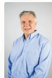
Olivier SALVETTI vice-président à la souveraineté alimentaire, à l'agriculture et à la forêt