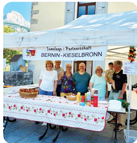
Faites du vélo

La cérémonie du 81 ème anniversaire de la "Victoire du 8 mai 1945" s'est déroulée au monument au mort en présence de Mme la maire, accompagnée de Mme la ministre déléguée chargée de l'Autonomie et des Personnes handicapées, M. le secrétaire général de la préfecture de l'Isère et de M. le conseiller délégué au devoir de mémoire.