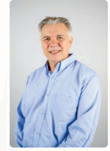
Olivier SALVETTI vice-président à la souveraineté alimentaire, à l'agriculture et à la forêt