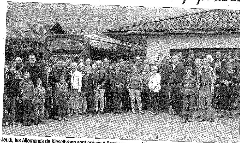
Jeudi, les Allemands de Kieselbronn sont arrivés à Bernin pour un séjour de quelques jours, dans le cadre du jumelage entre les deux villes.