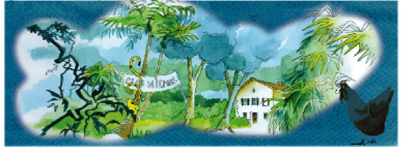
PEJ PROJETS POUR 2017