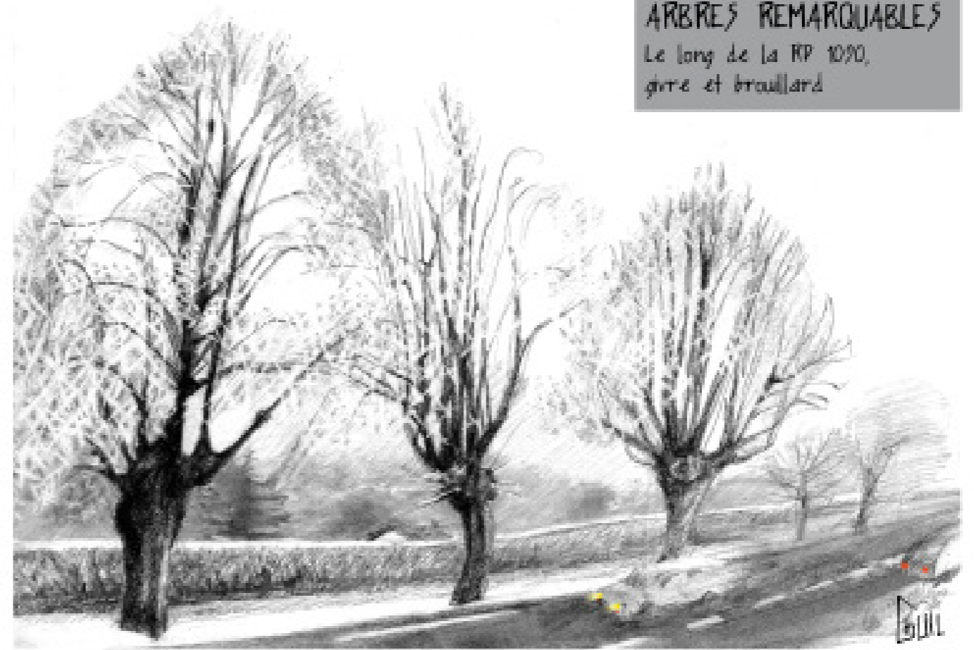
ARBRES REMARQUABLES Le long de la RP 1090, givre et brouillard