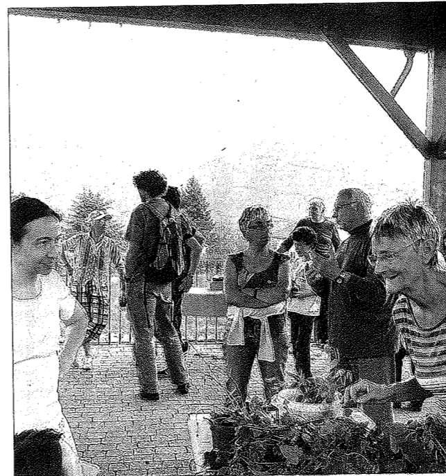
Les trocs de plantes de Bernin et de Saint-Nazaire-les-Eymes se sont unis le temps d'une journée.