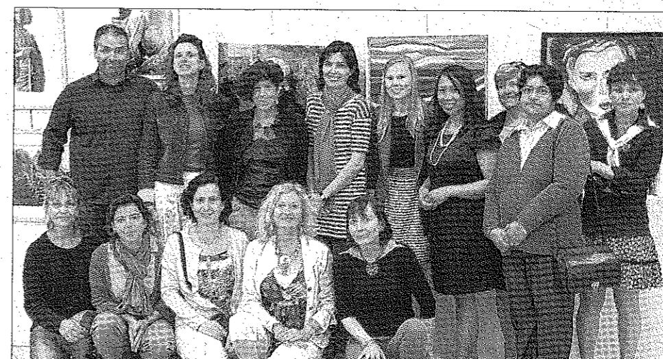
Les "Sweeties" organisaient une exposition de leurs créations : peinture, calligraphie, photo, aquarelle, bijoux, sculptures lumineuses, déco, vaisselle, scrapbooking.